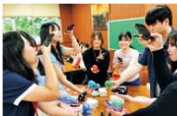
福島大学の学生の皆さんと赤べこ絵付け体験

同世代同士の交流も実施しました。福島大学を訪問し、キャンパスツアー、学食、赤べこ絵付け体験などを通じて学生の皆さんと終日交流しました。