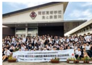
和歌山県立南部高等学校訪問の様子

また、相互交流として実施する職業系高校生訪韓団の派遣校である和歌山県立南部高等学校も訪問し、校内施設（農場・果樹園・牧場・加工施設など）を見学しながら、日本の農業高校の特色について学びました。昼食時には、調理コースの皆さんが作ってくれたお弁当を食べながら、学校生活や両国で流行っていることなどについて語り合いました。最初のうちは恥ずかしがっていた生徒たちも、次第に打ち解けていき、笑い声の絶えない一日となりました。