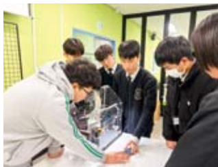
水原農生命科学高等学校訪問時、模型を組み立てながらスマートファームの設備について学ぶ様子

前述の南部高校の生徒約50名からなる職業系高校生訪韓団は、ソウル農業博物館（農業共同組合中央会設立）にて韓国農業の歴史について学んだほか、二日間の水原農生命科学高等学校訪問を通じ、韓国の生徒と多種多様なプロジェクトを行いながら現代の韓国農業について学びました。特にスマートファームを選択した生徒たちは、初日にアジア最大規模のスマートファームを運営している韓国企業を訪問し、スマートファームについての講義を受けたほか、実際に出荷されるまでの工程を見学させていただきました。2日目には実際にプラスチックの模型と基盤を組み立て、育てたい植物の生育環境を調査し、パソコン操作で温度や湿度を管理することのできるプログラム作りを行いました。プログラミング作り