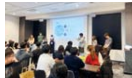
【対面交流】新大久保でのグループ別プロジェクト発表の様子

11月5日から8泊9日の日程で実施した訪日団でも、日韓の参加者同士での交流を実施しました。東京・新大久保でのグループごとのフィールドワークを実施