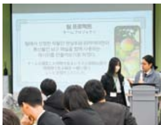
プロジェクト発表の様子

前述の南部高校の生徒約50名からなる職業系高校生訪韓団は、ソウル農業博物館（農業共同組合中央会設立）にて韓国農業の歴史について学んだほか、二日間の水原農生命科学高等学校訪問を通じ、韓国の生徒と多種多様なプロジェクトを行いながら現代の韓国農業について学びました。特にスマートファームを選択した生徒たちは、初日にアジア最大規模のスマートファームを運営している韓国企業を訪問し、スマートファームについての講義を受けたほか、実際に出荷されるまでの工程を見学させていただきました。2日目には実際にプラスチックの模型と基盤を組み立て、育てたい植物の生育環境を調査し、パソコン操作で温度や湿度を管理することのできるプログラム作りを行いました。プログラミング作り