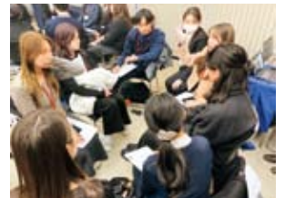
日韓合同の小グループで議論を交わす