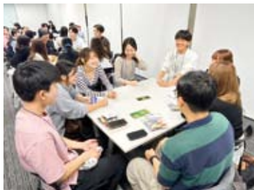
【対面交流】ソウルでのグループ別プロジェクトの様子

フィールドワークを通じて、学生からは「政治やメディアを通して抱いていた韓国のイメージがいかにか一面的だったかに気づかされた。直接の対話が、偏見を取り除く最も有効な