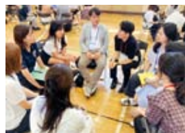
韓国の教員が訪日中に訪問した月島第一小学校(東京都中央区)の教職員との座談会の様子

日韓両国の小・中・高・特別支援学校の教員を対象とした「日韓学術文化交流事業」は、毎年6月に韓国の教員を日本に招へいする訪日団、8月に日本の教員を韓国に派遣する訪韓団を実施しています。日韓の教員同士の交流は、オンライン・対面交流を経て後続交流へと広がりを見せています。