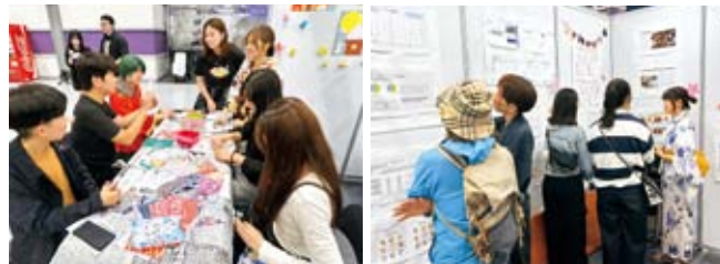
【日韓交流おまつり2025 in Seoul】でのブース運営

「和柄のしおり作り」ではしおりの形をした台紙にさまざまな柄の和紙を自由に切り貼りして、来場者のみなさんに世界で1つのオリジナルしおりを作ってもらいました。