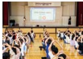
韓国の教員が訪日中に高麗川小学校(埼玉県日高市)で模擬授業を実施した様子

2025年度の教員訪日団は6月3日から11日までの8泊9日間、「日韓国交正常化60周年、日韓交流の足跡探訪及び日本の教育現場視察」というテーマの下、初等学校(小学校)の教員を中心とする第1団と中学校・高等学校の教員等で構成される第2団の計95名を迎え、埼玉県、栃木県、群馬県、茨城県を訪問しました。一行は文部科学省による講義聴講、各種学校や教育関連施設の視察等を通じて、日本の教育政策や教育現場に対する知見を得るとともに、一般家庭でのホーム