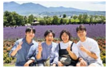
ホストファミリーと

後半日程では、北海道を訪問しました。札幌で2泊3日のホームステイを行い、北海道教育大学札幌校で同世代交流を実施しました。特筆すべきは、大学訪問時