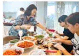
日本の教員が訪韓中に訪日団参加者の韓国教員の家でホームステイを実施