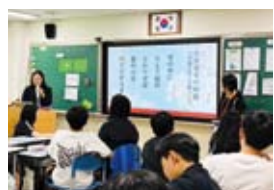
日本の教員が訪韓中にソウルへ入り、中等学校で模擬授業を実施した様子

また、「日韓学術文化交流事業」は訪日・訪韓事業のみにとどまることなく、2024年度以降、訪日団と訪韓団の間の期間に、オンライン交流を1回、教員訪韓団実施期間中に対面交流を1回、訪韓団実施後に再度オンライン交流を1回、計3回の日韓の団員間交流事業を展開しています。これはコロナ禍に実施した「日韓教員オンライン交流プログラム」に着想を得て、コロナ禍以前はそれぞれ独立した事業として実施していた教員訪日・訪韓事業を改編したものです。日韓の教員が訪日・訪韓事業への参加を通じて見聞を深めた内容に