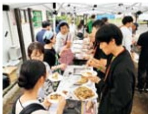
福島市民の皆さんとの交流会

さらに、福島と韓国の交流に25年以上ご尽力された「NPO法人ふくかんねっと」が市民の皆さんとの夏祭りを開催してくださいました。韓国語を学ぶ中学生から70代までさまざまな年代の方々 30名程が集まり、団員たちとともに、流しそうめん、