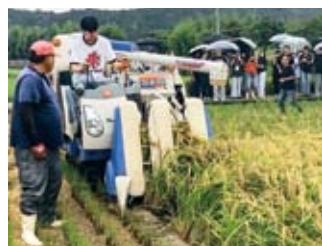
米農家視察の際、団員がコンバインを操縦させてもらっている様子

韓国の農業系高等学校に通う生徒たち約50名の主な訪問地は和歌山県でした。フルーツ王国と呼ばれている和歌山県。訪日団の訪問時期である9月下旬には、ぶどう・柿が旬の時期で、農家の方から苦勞されている点やより良いものを収穫するために努力されていることなどについて伺い、実際に収穫体験も行いました。ぶどう農家では、紙袋に覆われたぶどう一房ひと房を下から覗き込みながら、収穫物が市場に出回るまでの苦勞を実感し、柿農家では日本にしかない品種の大ぶりな柿を特別に収穫させていただきました。また、ちょうど稲刈りの時期だったこともあり、コンバインを使った稲刈り体験も行い、ある生徒は「授業で日本の有名な農機メーカーのコンバインについて習ったが、実際に稲刈りをしている様子を見ることができて嬉しい」と話していました。